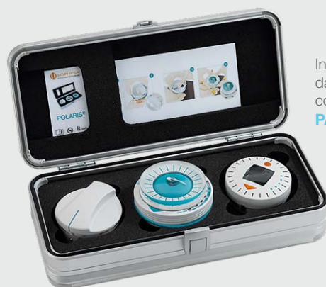
Insérée dans le coffret PAK2

Un instrument qui trouve sa place dans le kit de réglage mécanique de Polaris® (PAK2)